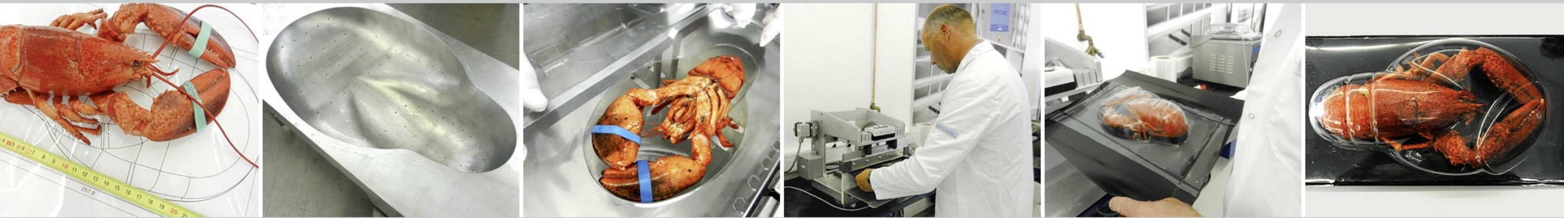
Beispiel eines Verpackungskonzeptes, das für einen Kunden exklusiv entwickelt wurde.

Ein großes Sortiment von Standardschalen verschiedener Ausprägung halten wir in unserem Lager in Zarrentin bereit.