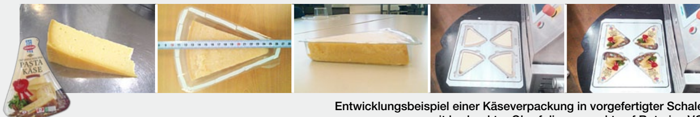
Entwicklungsbeispiel einer Käseverpackung in vorgefertigter Schale mit bedruckter Oberfolie, verpackt auf Rotarius VG

Wir bieten Ihnen die Kombination aus Verpackungsmaschine, perfektem Konzept sowie der passenden Folien bzw. Schalen. Alles aus einer Hand – für die ideale Verpackung Ihres Produktes!